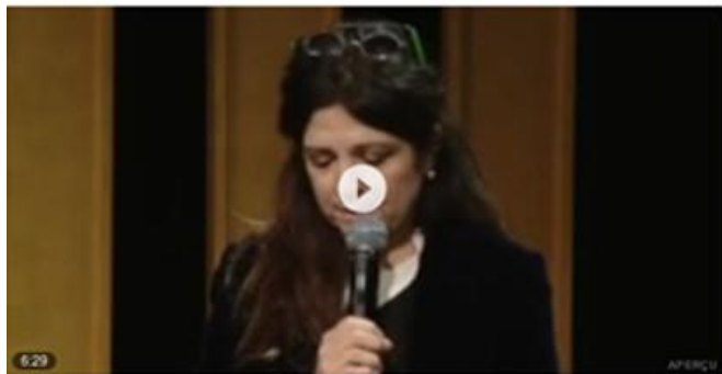
Le discours féministe puissant d'Agnès Jaoui rouTube - Telerama - 26 nov. 2020

Agnès Jaoui bouleverse avec un puissant discours aux Assises du collectif 50/50 (25/11/2020).